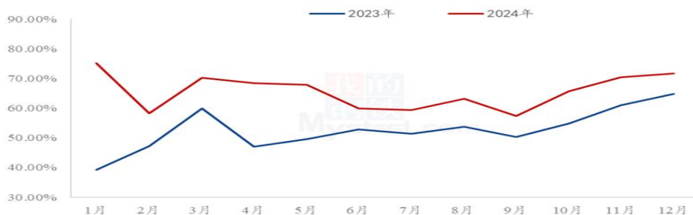
2023—2024年国内玉米淀粉行业月度开机走势

本年度，国内玉米淀粉价格整体呈现明显下跌。截止到12月底全国玉米淀粉现货价格2720元/吨，较年初3140元/吨，下降420元/吨，跌幅为13.38%。