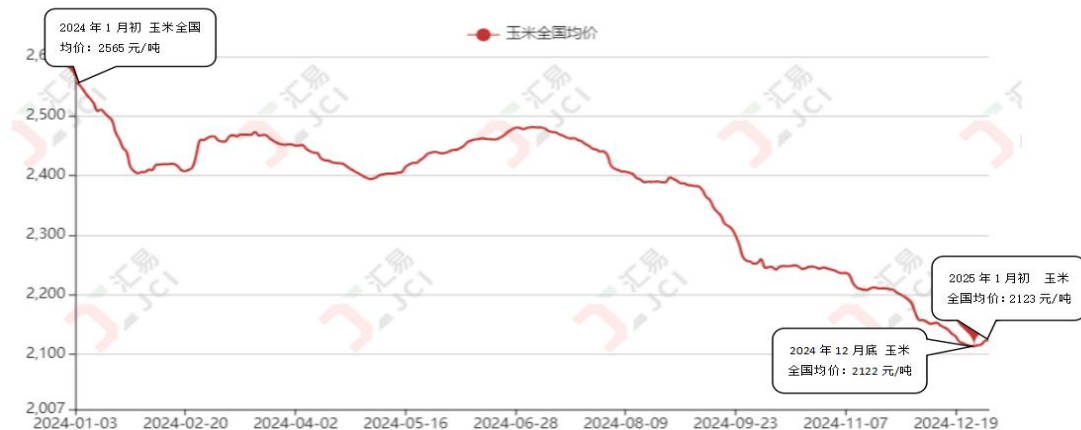
二等玉米现货价格日报-单位：元/吨